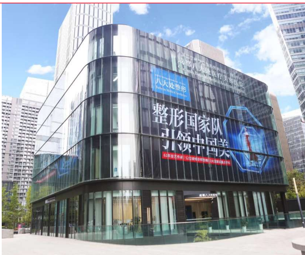
成都八大处医疗美容医院

据天投金控公司相关负责人介绍,这一项目是公司布局大健康产业链的第一步,合作主要以股权投资为主,未来天投金控公司将整合金融链、产业链、创新链等资源打造天府新区大健康产业。“我们有严格的投资标准,只有社会效益与经济效益并重的项目,才会被纳入考核范围。”天投金控公司的相关负责人透露,目前,公司正在跟省市及国家级的医院、健康产业机构对接,探讨将各类优质医疗资源引入新区。